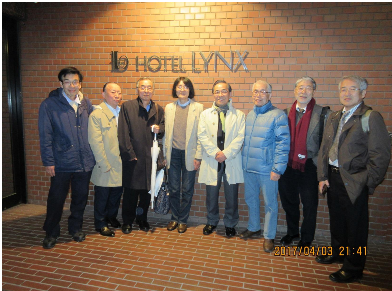
宴も終わりホテルリンクス前・誰も替わろうと言わないので私は写っていない、撮影者：金川