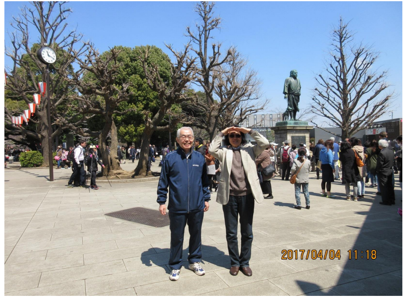
ようやく増田がやって来た！