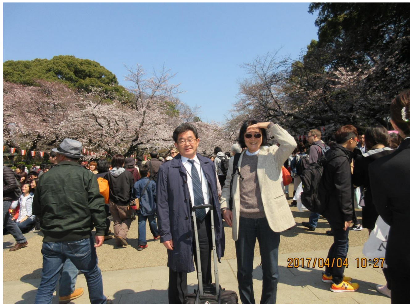
朝 10:00 ・上野の山の花盛り、ウィークデーで外人だらけ、アメリカ人と記念写真